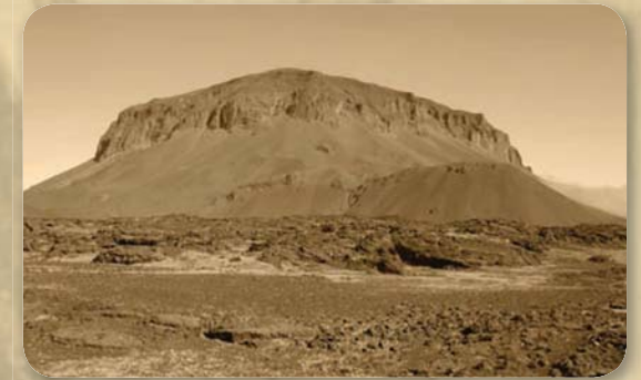
Herðubreið séð frá norðri / Herðubreið seen from north.

Iceland had its fair share of outlaws. Early, as well as more recent, literature swarms with stories of them. They are abundant in the medieval sagas; three of which have an outlaw as its hero – most notably Grettir the Strong – and all of them came to tragic ends. Of course, these three were honourable men driven out of human society through some unfortunate quirk of fate. However, most outlaws were simply misfits and criminals, unable to live among others and forced to eke out a meagre existence on the edges of society, largely by thieving and banditry. The stories told in the sagas are often reminiscent of the outlaws in the ‘Wild West’, perhaps not surprising as many have noticed the general similarity between the Icelandic sagas and the stories of the West. Outlaws persisted in Iceland until the 19th century. Although, after the enormous eruptions in The Mist Hardship in 1783 the number of outlaws seems to decrease and the most known one, Eyvindur of the Mountains, died that year. They usually sought