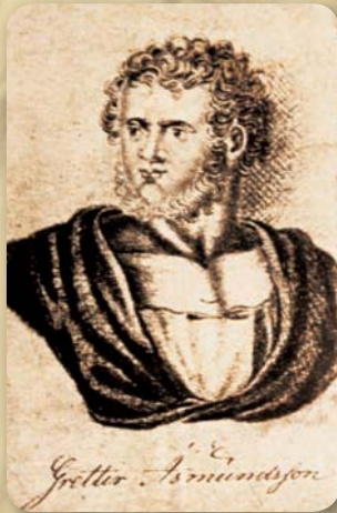
Grettir Ásmundsson. Teikning eftir / Drawing by Sigurður Guðmundsson.

Það er vel við hæfi að sýning um útilegumenn sé haldin að Kiðagili í Bárðardal. Titill sýningarinnar er Útilegu-