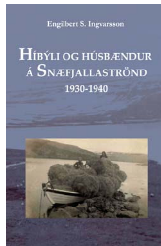
Híbýli og húsbændur, kilja – kr. 2000