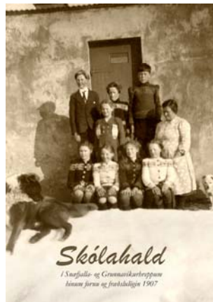
Ritlingur um skólahald - kr. 500